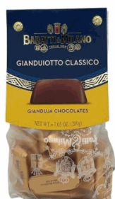
SACCHETTO GIANDUIOTTO CLASSICO 200GR X 10 BARATTI