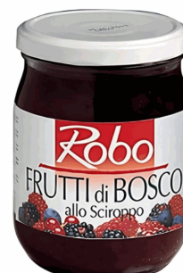
FRUTTI DI BOSCO 0,58KG 6U ROBO