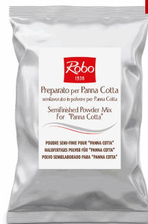
PANNA COTTA 960GR(160X6) 4 ESTUCHES CAJA ROBO