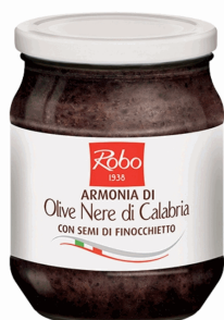
ARMONIA OLIVE NERE 530G 6U ROBO