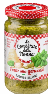
PESTO ALLA GENOVESE 185G 12U CONSERVE NONNA