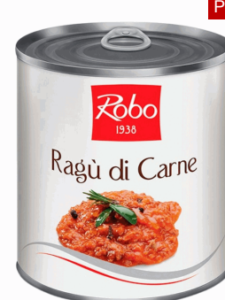
RAGU DI CARNE SUINA 800G 6U ROBO