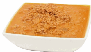
SALSA BOLOGNESE JAMON/MORTADE 250G X 5UD NEGRINI