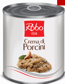
CREMA FUNGHI PORCINI 800G 6U ROBO