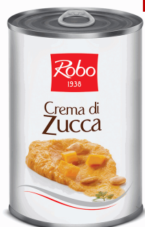
CREMA DI ZUCCA 400G 6U ROBO