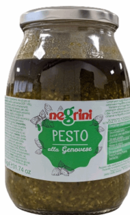
PESTO GENOVESE O. OLIVA 0,9KG 6U NEGRINI