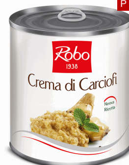
CREMA CARCIOFI 800 GR X 6 UDS ROBO