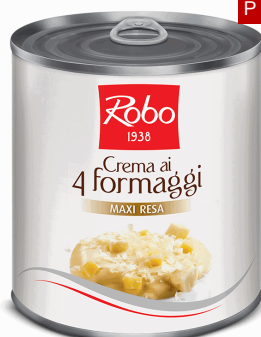
CREMA 4 FORMAGGI 800 GR X 6 UD ROBO