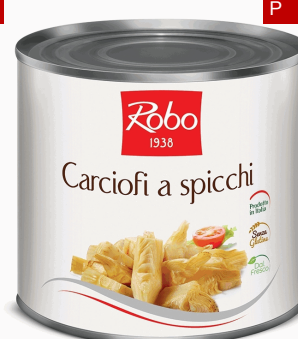
CARCIOFI SPICCHI AL NATURAL 2,5 KX6 UD