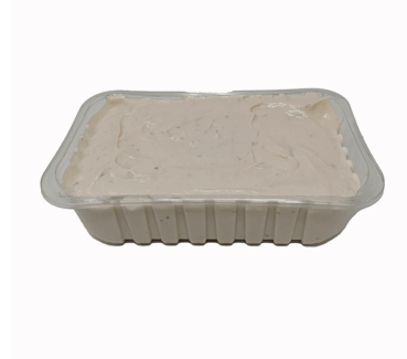
SALSA TONNATA 1KG X 1UD NEGRINI