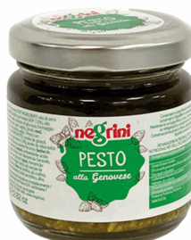
PESTO GENOVESE O. OLIVA 80G 12U NEGRINI