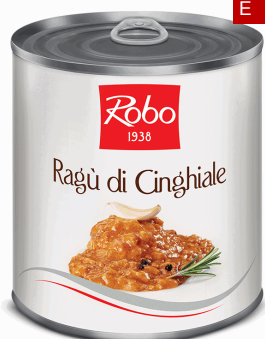
RAGU DI CINGHIALE 800G 6U ROBO