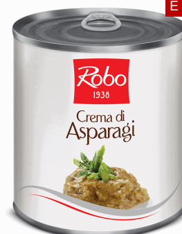
CREMA DI ASPARAGI 800 GR X 6 U ROBO