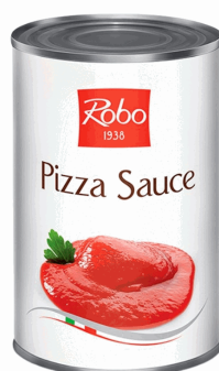
PIZZA SAUCE 4,1 KG X3UDS