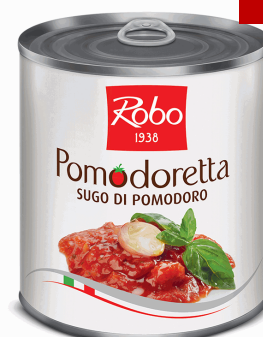
SUGO AL POMODORO POMODORETTA 800 GX6