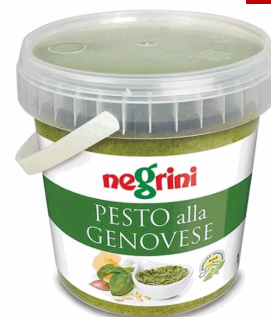
PESTO FRESCO DOP 1KGX4UD NEGRINI