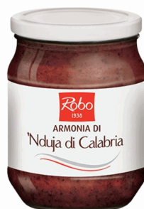
ARMONIA NDUJA DI CALABRIA 260GRX6UDS