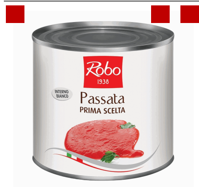
PASSATA DI POMODORO 2,55 KGX6 UDS ROBO