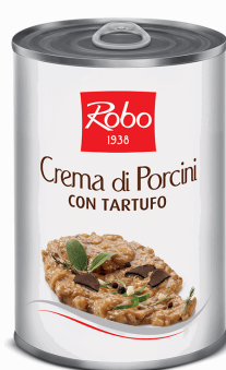
CREMA F.PORCINI C/TARTUFO 400 GX6U ROBO