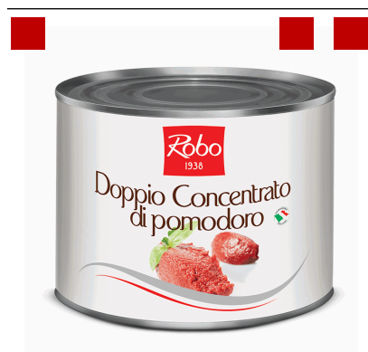
DOPPIO CONCENT POMODORO 2KG 6U ROBO