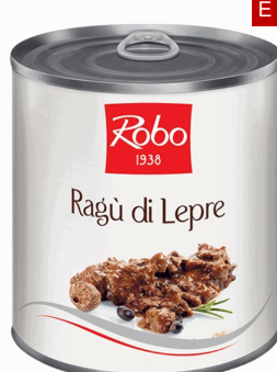
RAGU DI LEPRE 500 GR X 6 UD ROBO