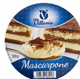
MASCARPONE 500 GR X 6 UDS VITTORIA