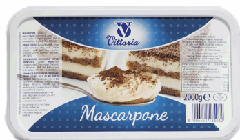
MASCARPONE 2KG X 3UND VITTORIA