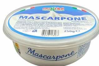
MASCARPONE 250GR X 6UD NEGRINI