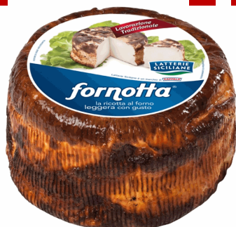
RICOTTA AL FORNO TENERA 2KG X 1UD ZAPPALÁ