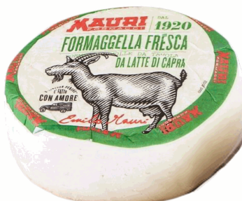
FORMAGGELLA FRESCA DI CAPRA 300G X 8UD MAURI