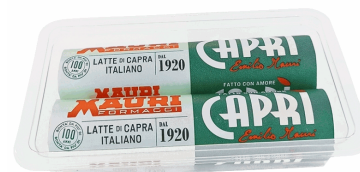
CAPRÌ DI CAPRA 160G (80GX2U) 9U/CAJA MAURI