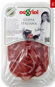
COPPA ITALIANA "NICOLETTA NEGRINI" 80GRX6UD