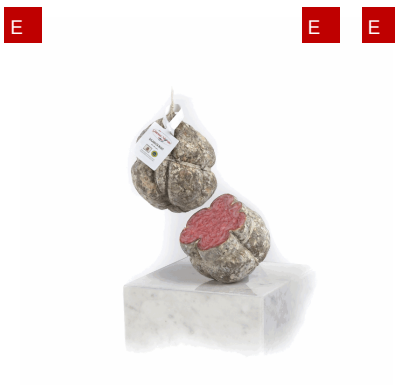
SALAMA DA SUGO IGP CRUDA 1KG X 8 GIANNI NEGRINI