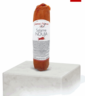
SALAME NDUJA 500GX10U NEGRINI