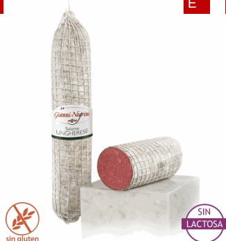
SALAME UNGHERESE 3 KG 1U