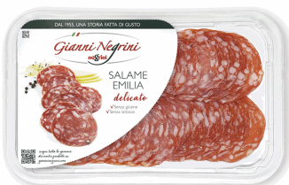
SALAME EMILIA 80G X 6UD NEGRINI