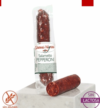
SALAME PEPPERONI 0,3KG 12U