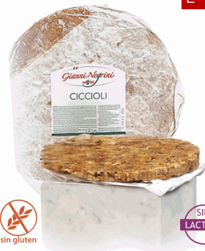
CICCIOLI CROCCANTI 800 GR X 4 UDS