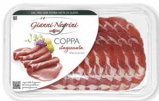
COPPA ITALIANA 80G X 6UD NEGRINI