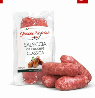
SALSICCIA FRESCA 250G(4UDS)X10 NEGRINI