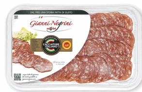
SALAME CACCIATORE DOP 80 GR X 6 NEGRINI