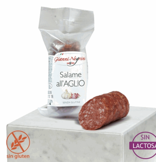
SALAME ALL'AGLIO 125G X 8UD NEGRINI