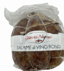
SALAME AL VINO ROSSO IN VESC. 1KG X 4U NEGRINI