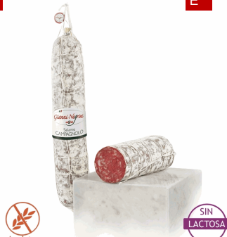
SALAME CAMPAGNOLO 1,5 X 2 UDS NEGRINI