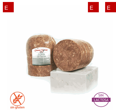
COPPA DI TESTA 3 KG X2UD NEGRINI