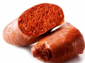
NDUJA DI SPILINGA CRESPONE 400G X 16U ONLYGOOD