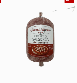
IMPASTO SALSICCIA DA CUOCERE 500GR X 5U NEGRINI