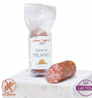
SALAME MILANO 125G X 8UD NEGRINI