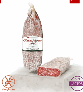
SALAME ABRUZZESE 300G X 6 UD SCHIACCIAT