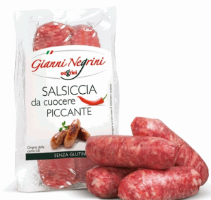
SALSICCIA FRESCA PEPERONCINO 250G(4UDS)X10 NEGRINI