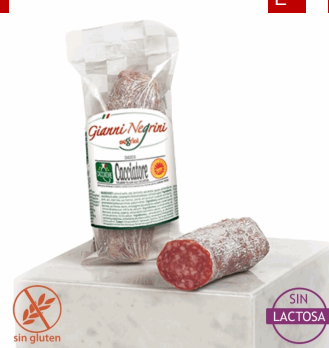
SALAME CACCIATORE 0,2 KG X 10 UDS NEGRIN