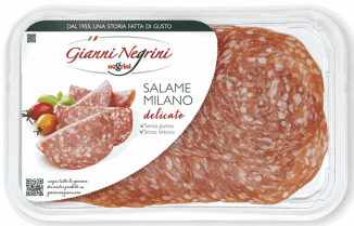
SALAME MILANO 80G 6U