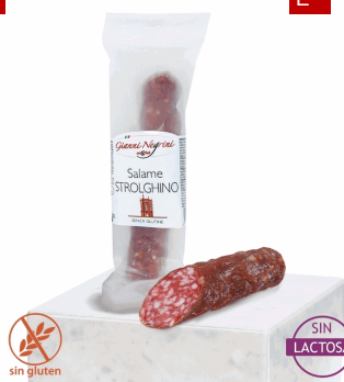
SALAME STROLGHINO 125G X 8UD NEGRINI