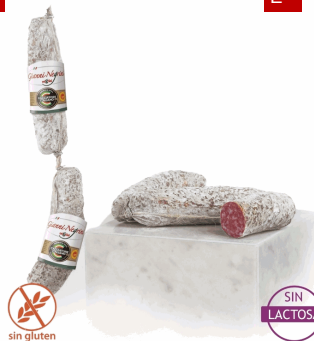
SALAME CACCIAT.MORBIDO FILZE 8x3 PZ