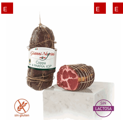
COPPA PARMA LEGATA A MANO 2 KG X 2U NEGRINI