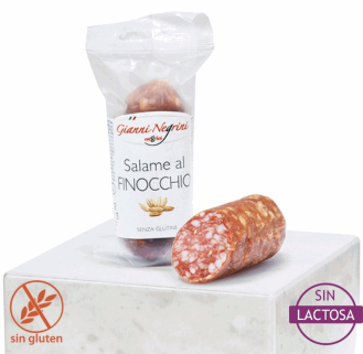
SALAME AL FINOCCHIO 125G X 8UD NEGRINI