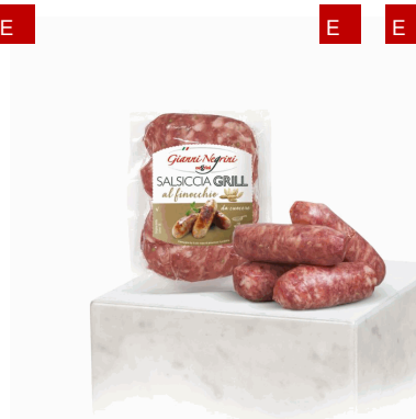
SALSICCIA FRESCA TOSCANA AL FINOCCHIO 250G(4UD)X10