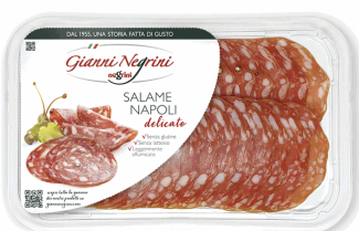
SALAME NAPOLI LONCHEADO 80GX6U NEGRINI