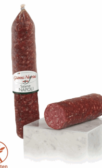
SALAME NAPOLI 1,5KG 2U