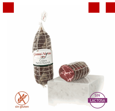
COPPA NOSTRANA 1,7KGX2U NEGRINI