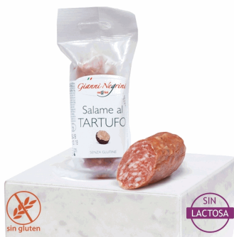
SALAME AL TARTUFO 125G X 8 UD NEGRINI