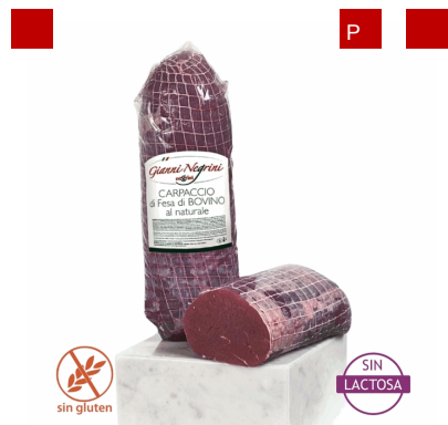
CARPACCIO DE VACUNO 1,5 KG X 2UD