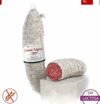
SALAME SOPRESSA 3KG 1U NEGRINI