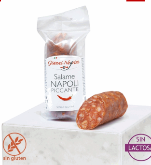
SALAME NAPOLI PICCANTE 125G X 8UD NEGRINI