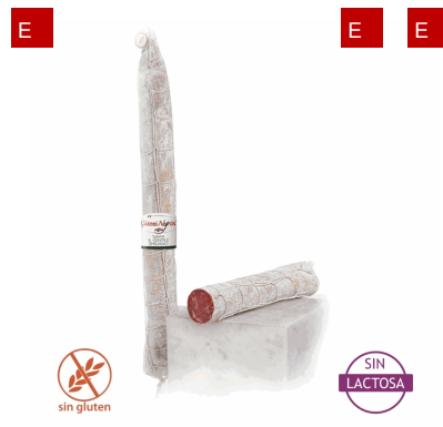
SALAME GENTILE 0,75 KG 3 UD