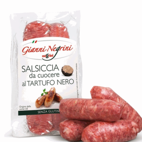
SALSICCIA FRESCA AL TARTUFO 250G(4UDS)X10 NEGRINI